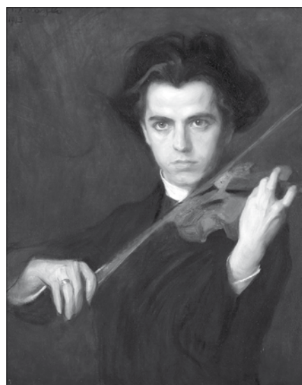
Jan Kubelik (1903)

Magángyűjtemény