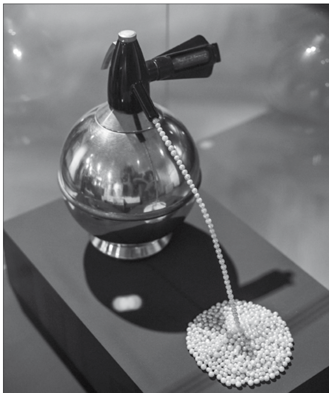
Szifonból elöngyöngöző üvegcspepek