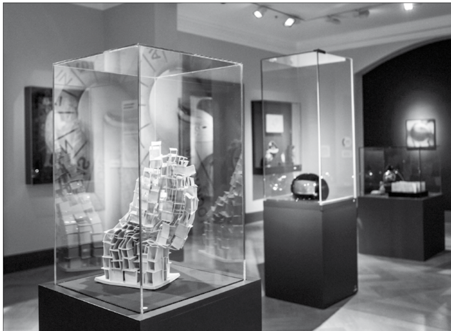
Diplomáciai ajándékok világórától ólomüveg plasztikáig