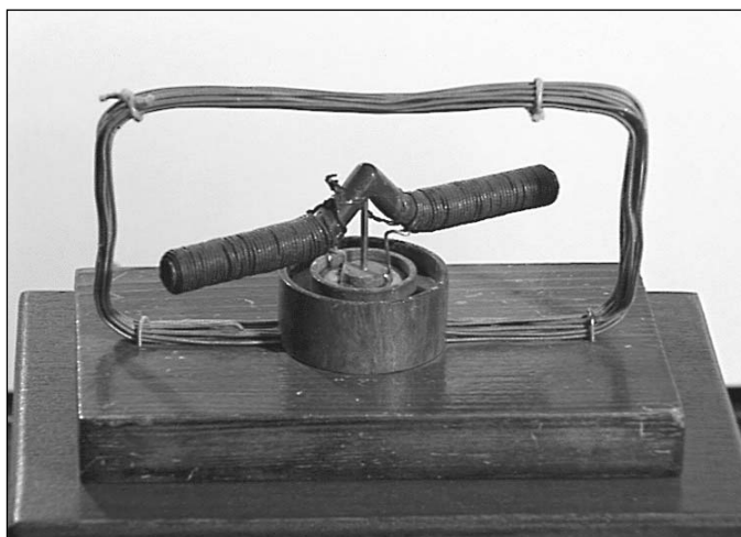
Jedlik Ányos forgonya

Ezért tekintették fontosnak, hogy a színvonalas oktatás érdekében a bencés szerzetesek a tudományok magas szintű művelői legyenek. A bencés gimnázium tanárai a szó legszorosabb értelmében tudós tanárok voltak, akik szakterületük kiváló művelői, kutatói voltak. Ennek, az egyrészt hagyományokon nyugvó, másrészt azonban az újat kereső oktatásnak részesei voltak, többek között: Kisfaludy Sándor és Károly , Reguly Antal , Deák Ferenc , gróf Batthyány Lajos , Xantus János , Petz Lajos , olyan tanárok mellett, mint Czuczor Gergely , Rónay Jácint , Rómer Flóris , Vaszary Kolos és nem utolsósorban Jedlik Ányos .