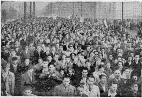
Az ifjúság hűletése.