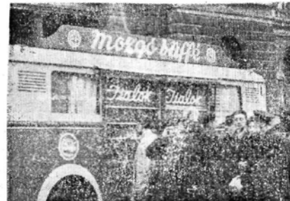
Újól izembe áll és nagy forgalmat bonyolít le a pestiek kedvelt mozgójúdája