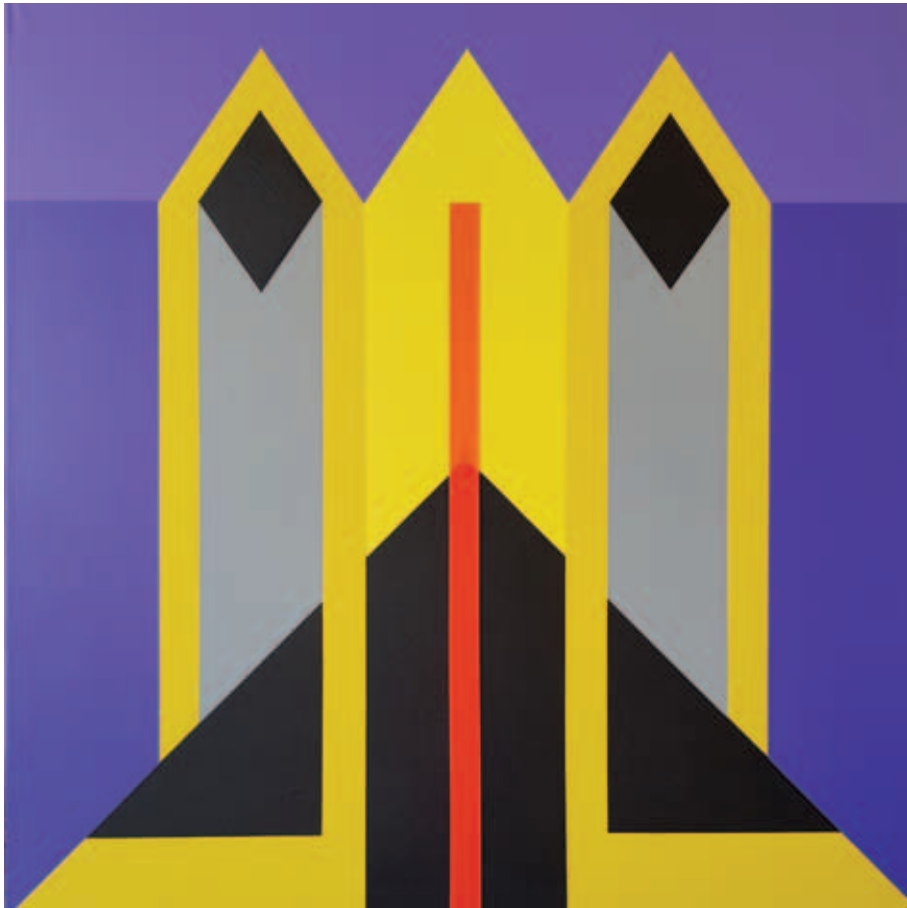
GNANDT JÁNOS, „Törvény” II–III., 2019