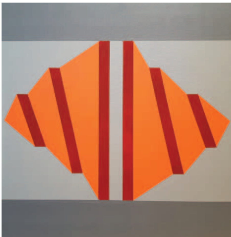
GIVANDT JÁNOS, „Geometria”, 2020; „Csavarodás”, 2019