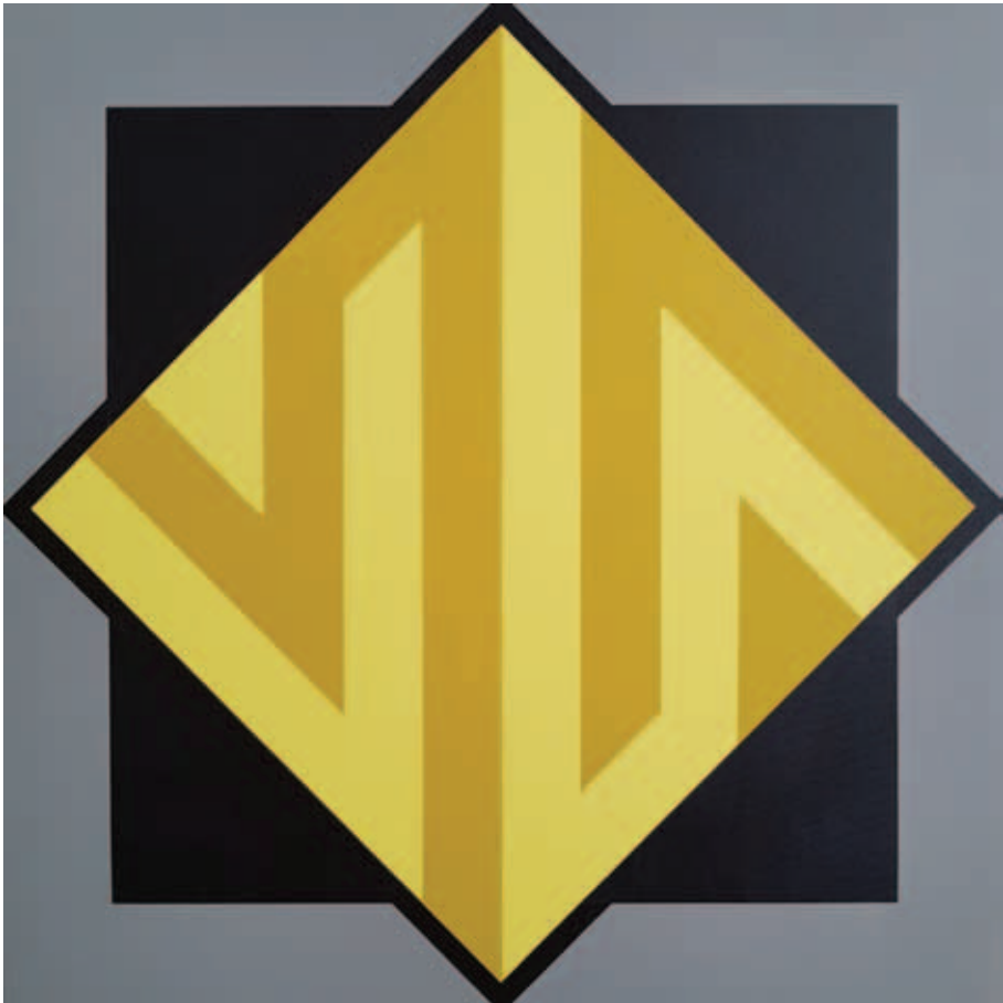
GNANDT JÁNOS, „Labirintus” I-II., 2020