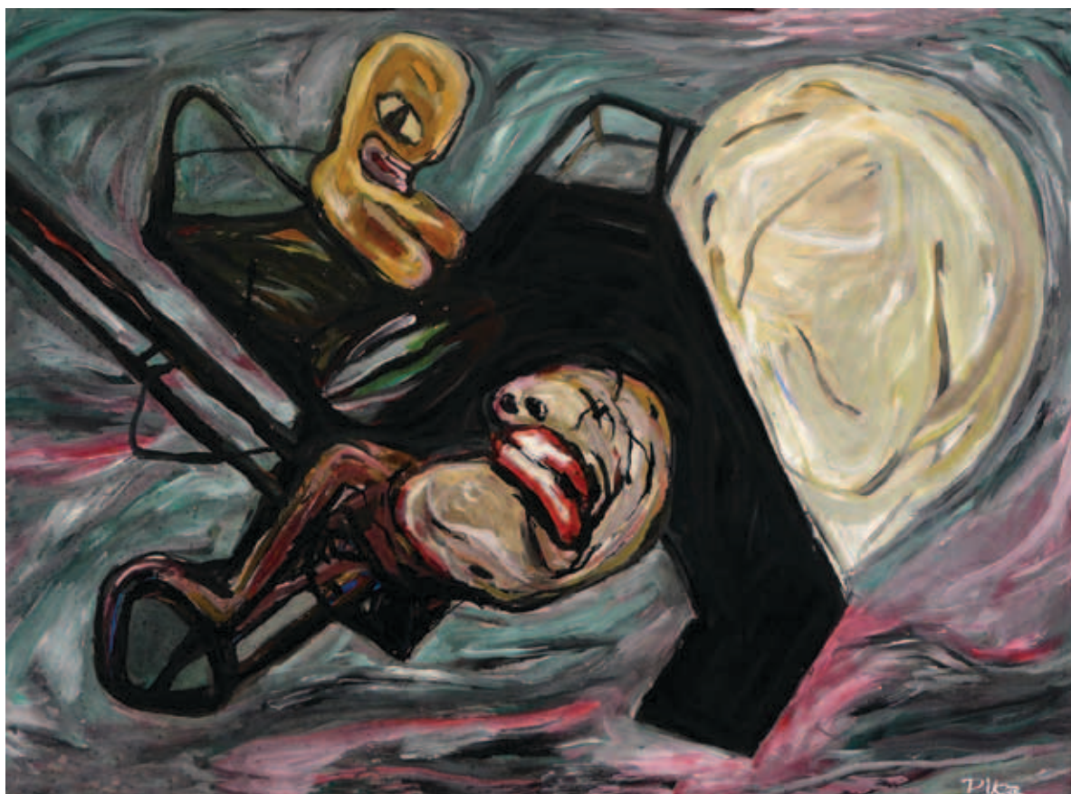
NAGY ÁRPÁD PIKA, Képlékeny tér 3., 1991; Roncs 4. (Jacuzzi-rajz), 1997