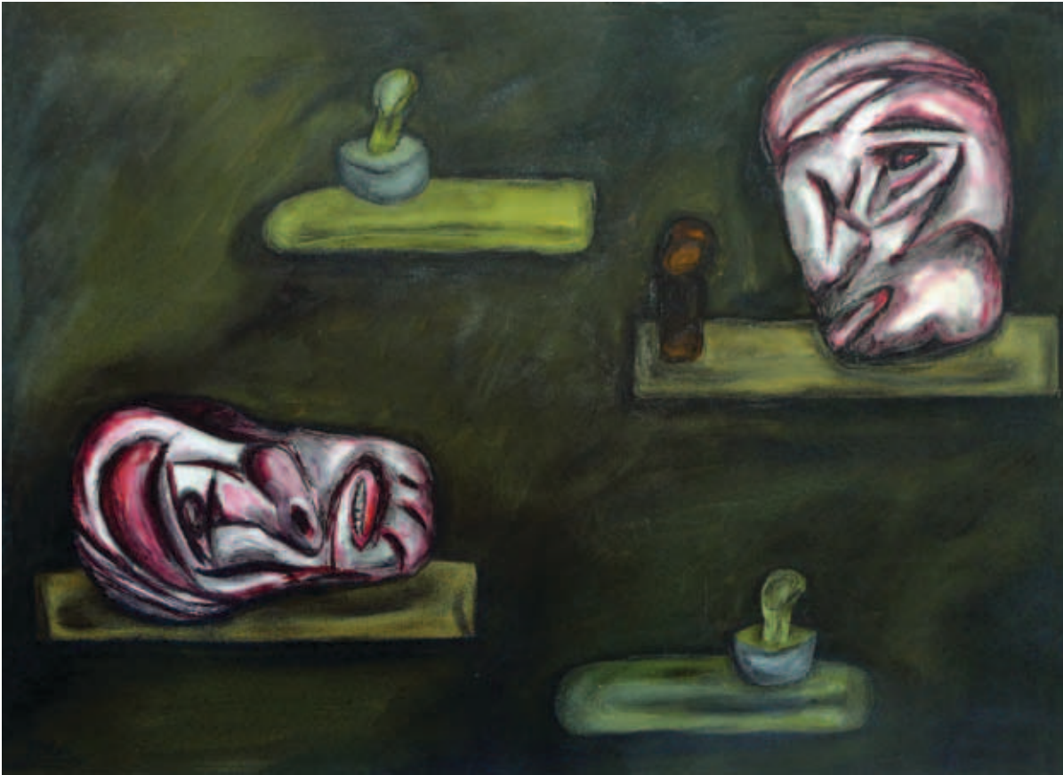
NAGY ÁRPÁD PIKA, Elődök 3., 1993–96 k.; Látomás 1., 1991