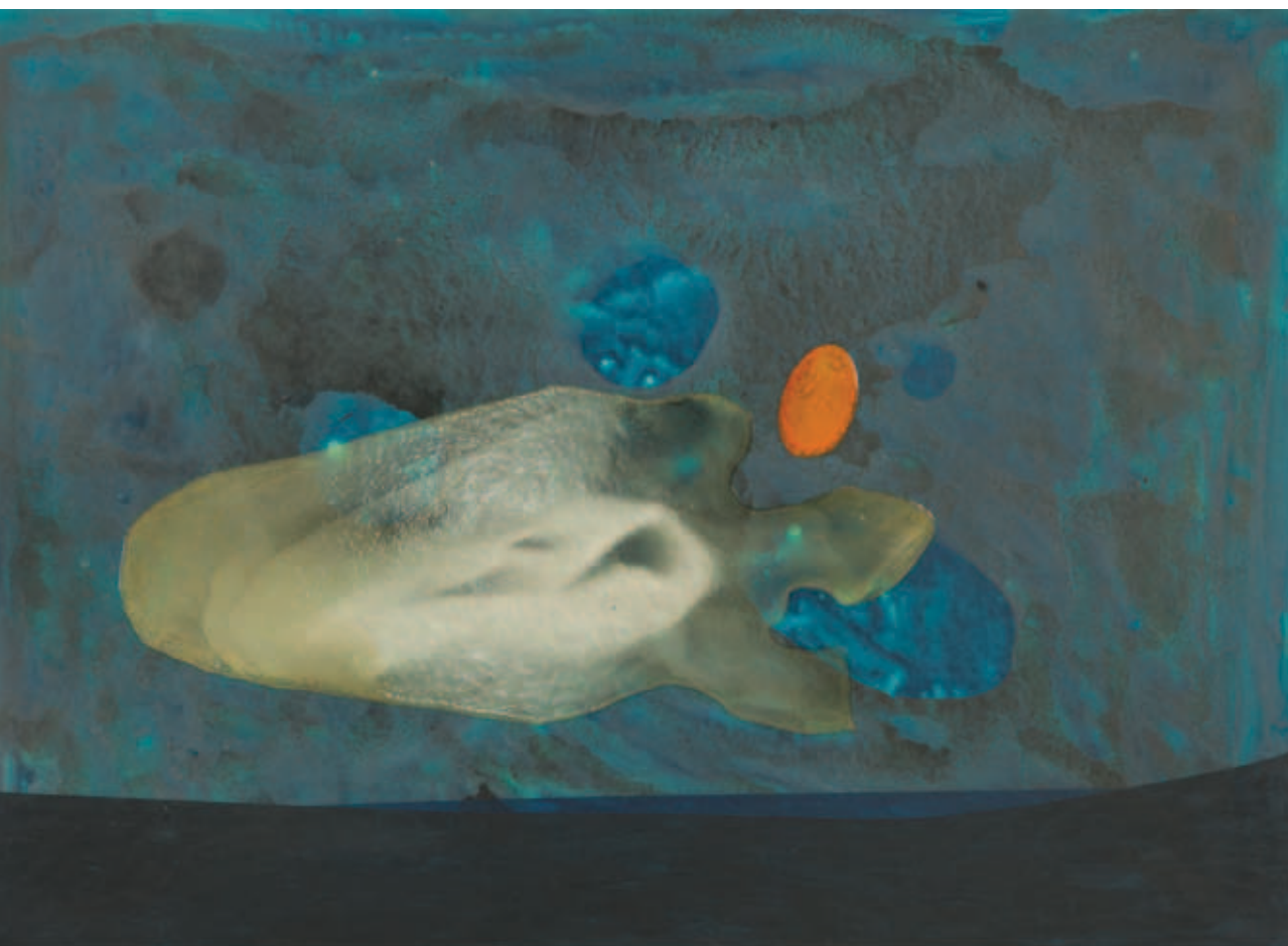
ROMVÁRI MÁRTON, Cím nélkül, 2018