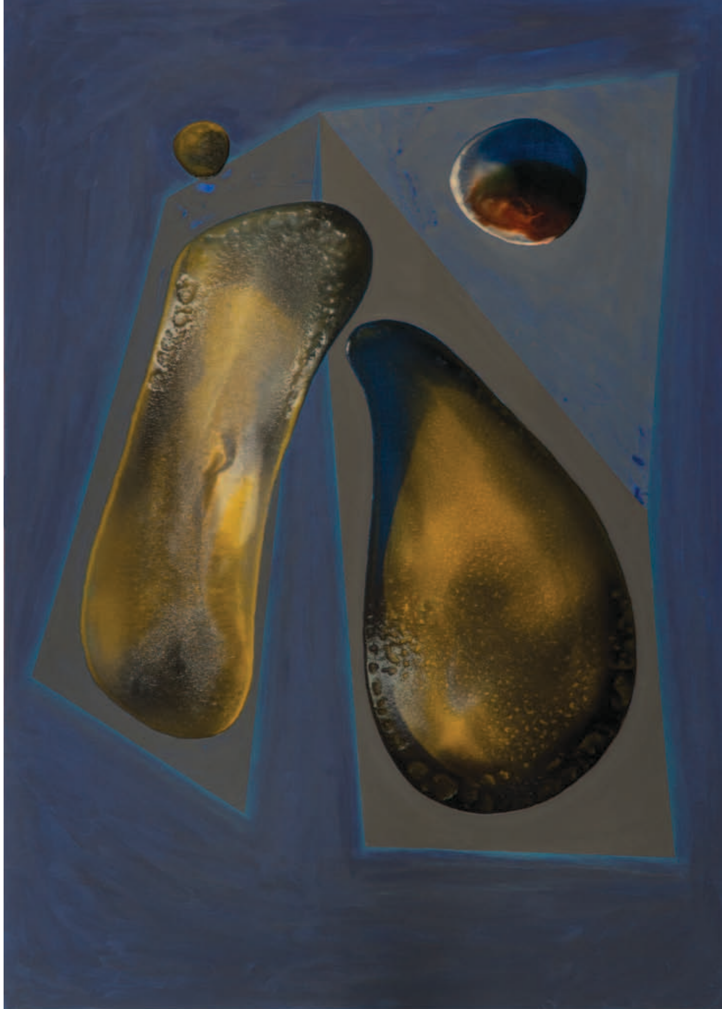
ROMVÁRI MÁRTON, Cím nélkül, 2018