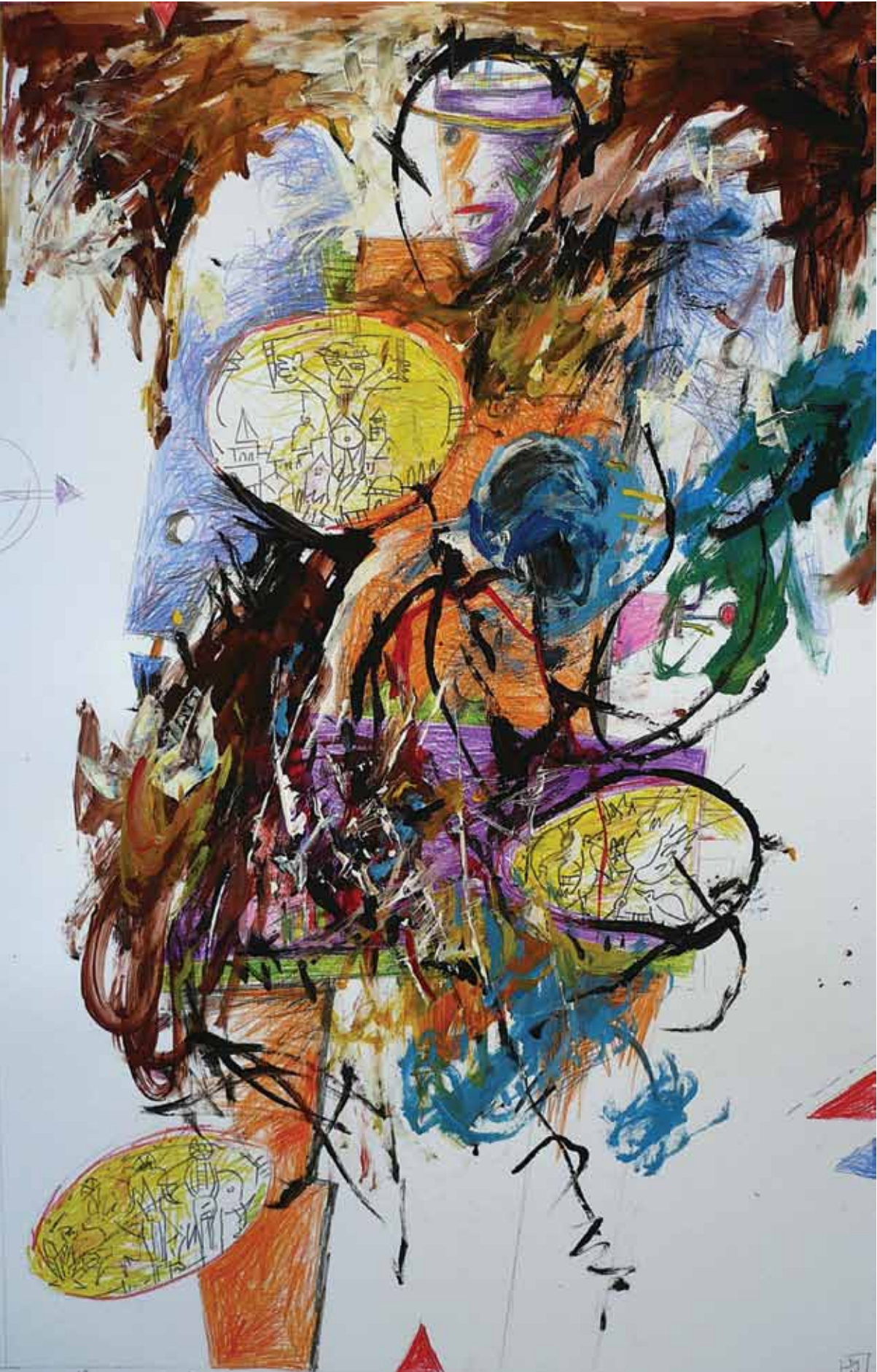
A székem időzónába esett, 2012