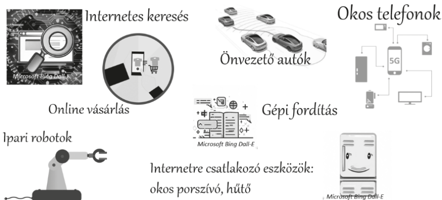
1. ábra. MI a mindennapi életben (Forrás Pixabay, Microsoft Bing Dall-E)

Az egészségügy területén is rendkívül fontos szerepet játszanak az MI-módszerek. Az orvostudományban alkalmazott MI képes nagy mennyiségű adatot elemezni és felismerni a mintákat, amelyek segítségével diagnózisokat és terápiás megközelítéseket lehet javasolni (Meskó és Görög, 2020). Az MI alkalmazása a közlekedési szektorban is forradalmasítja a mindennapi életünket. Az önvezető autók és az intelligens közlekedési rendszerek révén az MI segítségével javulhat a közúti biztonság, csökkenhet a balesetek száma. Az önvezető járművek képesek az útvonal optimalizálására, a valós idejű forgalmi információk feldolgozásával, miközben csökkenthetik a károsanyag-kibocsátást. (Németh, 2021)