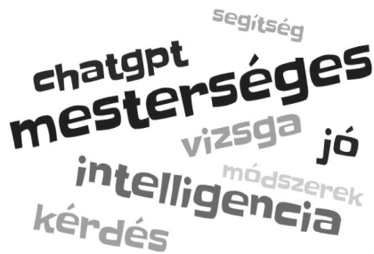
3. ábra. A fókuszcsoporthoz tartozó beszélgetés alatt leggyakrabban elhangzott szavak, kifejezések (saját szerkesztés)

A beszélgetés során leggyakrabban elhangzott szavakat és kifejezéseket a 3. ábra szófelhője mutatja.