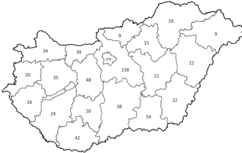
1. ábra. Tiltakozó intézmények száma megyénként

A tanári akciók országos elterjedése a ckipinfo.hu 10 adatai alapján az 1. ábrán látható.