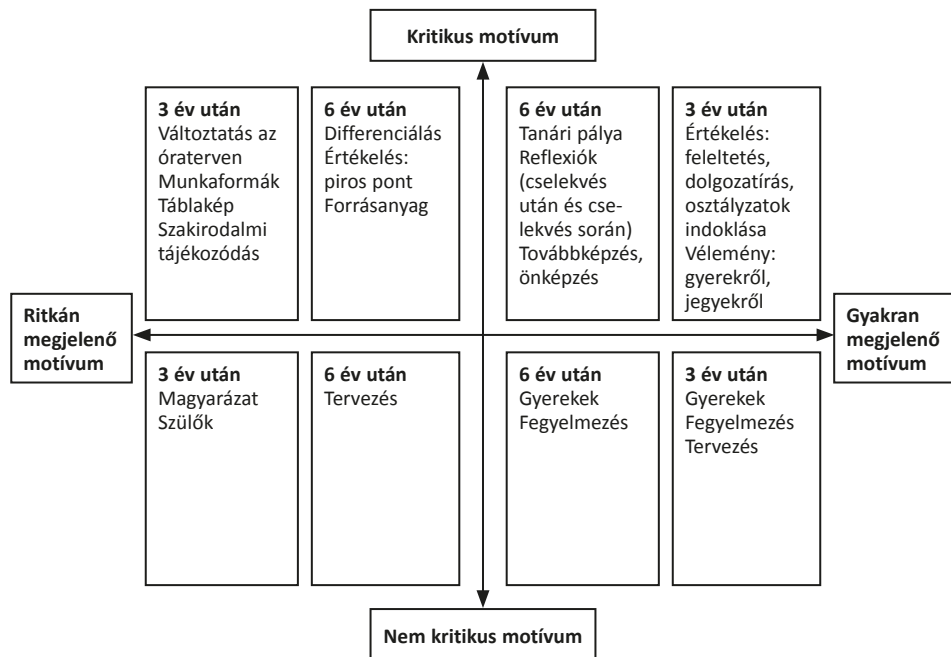
2. ábra. Típusklaszterek a 3. és a 6. pályán eltöltött év után