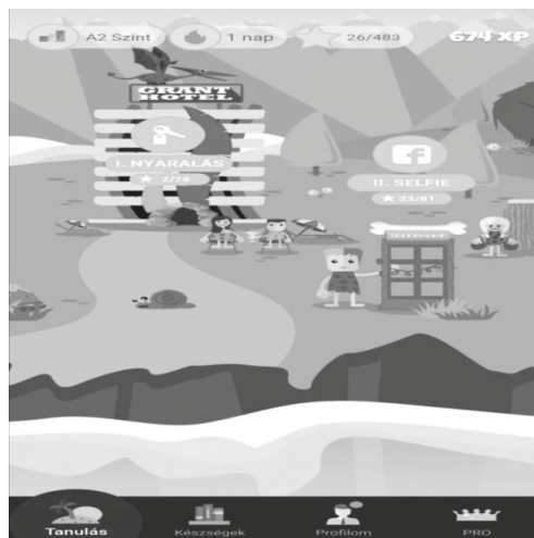
1. ábra. A Xeropan nyitó felülete

A Xeropan egy hazai játékos online nyelvtanulási alkalmazás. A Xeropan fejlesztőinek elképzelése, hogy világszerte 100 millió tanulót tanítsanak angol nyelven, és fejlesszék olvasási, írás-, beszédértési és beszédképességeit (Al-Gharawi, 2018). A rengeteg vizuális elem mellett a felhasználók írásban is látják a tananyagot. Az alkalmazás tudományos megalapozottságát Paivio (1991) kettős kódolási elmélete adja, amely alapján a verbális információ könnyebben megjegyezhető, ha vizuális elemek kísérik. Továbbá a munkamemória nyelvi komponensének szűk kapacitását is képes ellensúlyozni, ha vizuálisan is rendelkezésre áll az új információ. Az 1. ábra az alkalmazás nyitó felületét mutatja be.