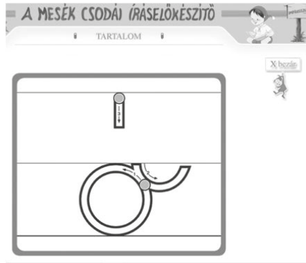
1. ábra. Az E-dinasztia kézirástanulást segítő digitális tananyag részlete

figyelembevételére is. Amennyiben az alkalmazást a tanulás további fázisaként nem interaktív táblán, hanem például tableten futtatjuk, a függőleges irányú vázolásról tovább léphetünk a finomabb mozgásokkal megvalósított vízszintes síkban történő vázolás felé.