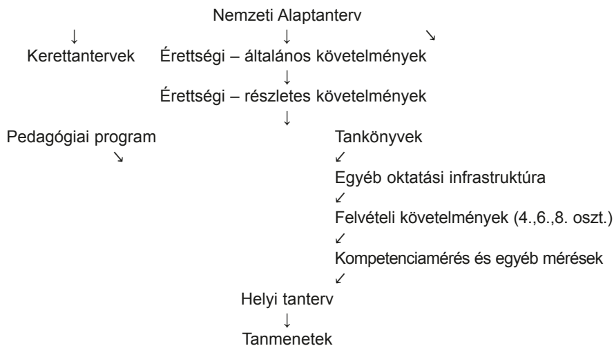
1. ábra. A tartalmi szabályozásra vonatkozó dokumentumok és az ezekre ható tényezők

A Nemzeti Alaptanterv a legmagasabb szintű jogszabály, amely az oktatás tartalmát szabályozza. Jogi státusa szerint kormányrendelet, amely tehát minden magyar iskolára és annak minden szereplőjére nézve kötelező. 4 Oktatásirányítási-pedagógiai filozófiája szerint a Nemzeti Alaptanterv azt a közös alapot, képességekészletet és tudásanyagot tartalmazza, amelyet minden magyar diáknak el kell sajátítania. Mint a legmagasabb szintű jogszabály befolyásolja, sőt, ütközés esetén felülírja az alacsonyabb szabályozási szinteket. Mivel státusánál fogva nagyon általános kell legyen, ezért ennek lefordítása történik meg az alacsonyabb szintű jogszabályokban. Jelenleg két ilyen jogszabály létezik, a kerettantervekről szóló, valamint az érettségiről szóló szabályozás. 5