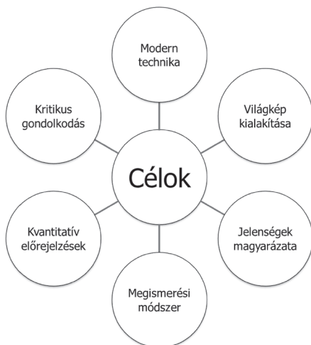
1. ábra. A természettudományok tanítási céljai

alkotást, az elvonatkoztatást, melyet a fizikán kívül a többi természettudomány, sőt napjainkban a társadalomtudomány is alkalmaz. Az ő megközelítése szerint a jelenségeket célszerű olyan leegyszerűsített körülmények között vizsgálni gondolatkísérletek segítségével, amelyek a valóságban nem figyelhetők meg: például magára hagyott test mozgása, szabadesés vákuumban. Miután így megvizsgáltuk a jelenséget, akkor már érdemes figyelembe venni a jelenség valódi lefolyásakor érvényesülő tényleges hatások