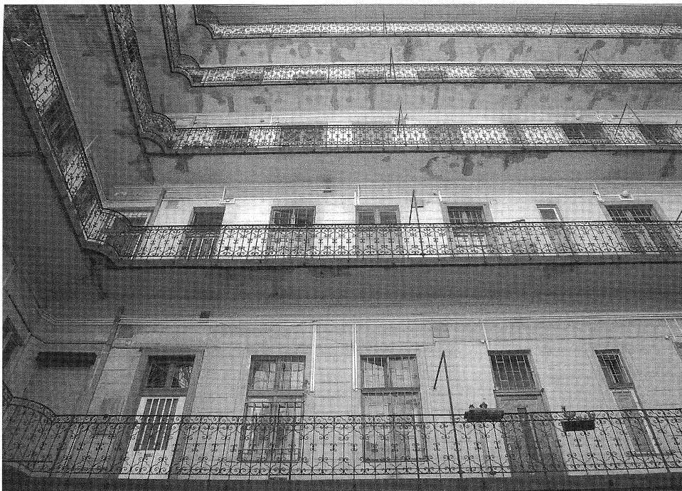
A Rákóczi út 29. számú ház körfolyosós belső udvara 2008

„A 4-6 szobás lakásokat kizárólag a középosztály tagjai bérelték.”