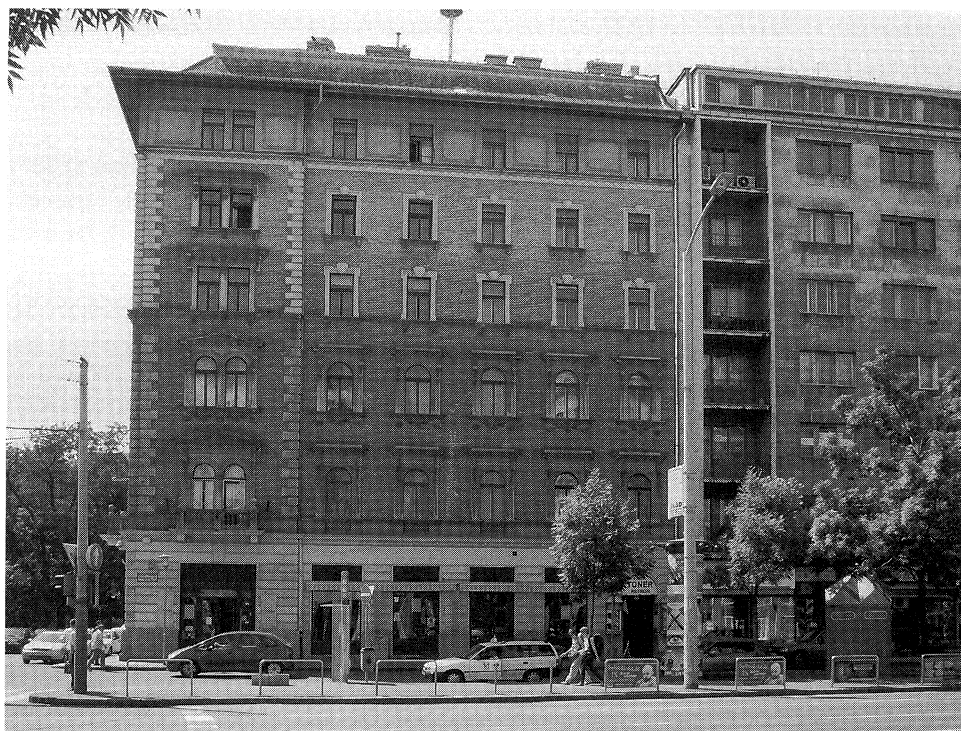
A Rákóczi út 29. számú ház homlokzata 2008

„...két teremnek titulált hatalmas szobát, valamint »inas szobát« is megneveztek.”