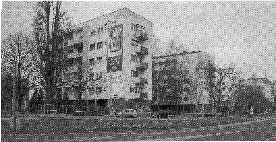
A Lehel téri lakóházak 2008.

„...ővönő, kazánkovács, háztartásbeli, mérnök, orvos, gyári munkás, pártfunkcionárius, az AVH tisztje ...”