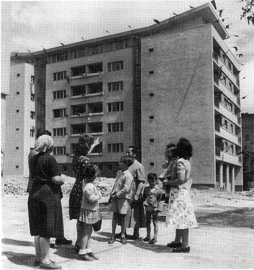
Lehel téri élmunkásház avatása 1950. június

„...a vasasok 3-at kaphattak, miközben a jogos (élmunkás) igény 160 db volt ...”