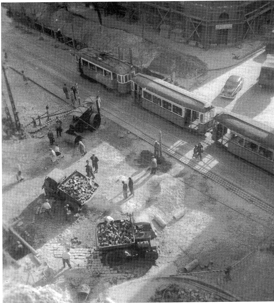
Tereprendezés a Lehel utca és a Bulcsú utca sarkánál 1950 körül

„Kérdem, mi a fontosabb, egy jó konyha, egy kitűnően felszerelt fürdőszoba, avagy az oszlopos homlokzat?”