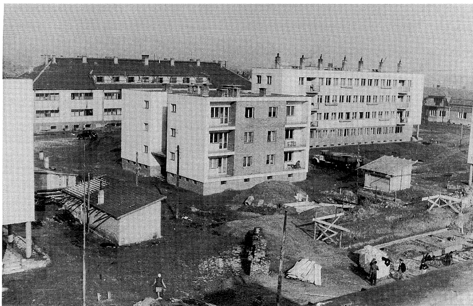
A csepeli Béke téri élmunkásházak 1950

„A lakásínség 1954/55 fordulójára oly mértékűvé vált, hogy a helyzet csaknem fegyveres konfliktussá fajult...”